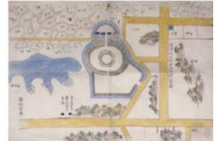
摂津州大坂茶臼山陣営図