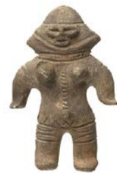
山形土偶 茨城県稲敷市椎塚貝塚 縄文時代後期後半(紀元前1800年) 大阪歴史博物館蔵