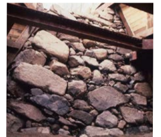
今も地下に眠る豊臣石垣