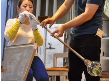
吹きガラス教室の授業風景