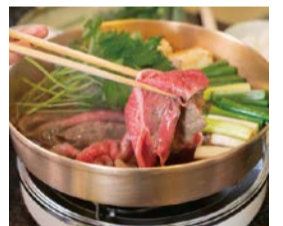
食文化体験プログラム 提供料理のイメージ

「大阪が育んだ食文化の特別な体験」をテーマに、有名料亭で味わう食文化体験やオンライン料理教室など、さまざまな体験プログラムを開催。詳しくはぐるたびホームページをご覧ください。