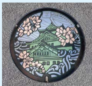
下水道事業100周年記念デザイン