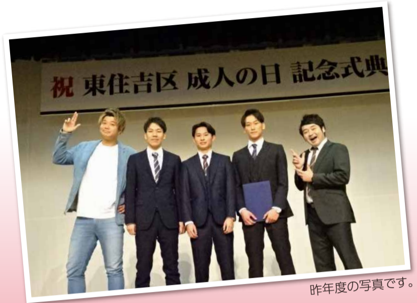
昨年度の写真です。

なお、申込受付は終了しており、当日の参加受付は行いません。(感染症拡大防止のため、今年は会場を分け、事前申込制としておりますので、ご理解のほどお願いいたします。)