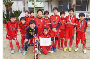
▲優勝チーム パスドゥーロ