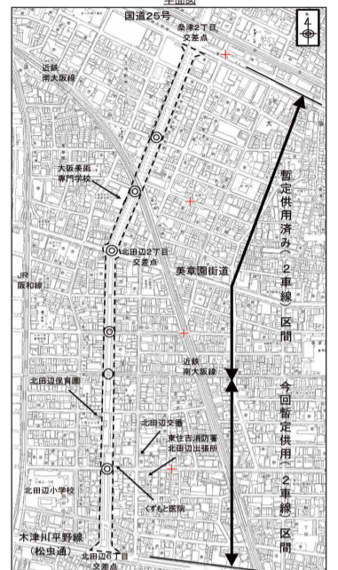
道路を整備する区域「豊里矢田線」 信号設置箇所 ○ 来年度以降に信号機を設置する箇所 ※信号設置までの間は、交差点前後に車両減速対策「クラック」を設置