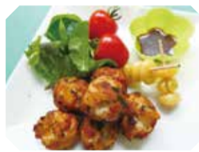
区食生活改善推進員協議会 担当：田辺校区