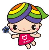
大阪市人権啓発マスコットキャラクター「にっこりな」

地域には病気や障がい、介護、子育てなど配慮や支援などが必要な方がいます。過剰な詮索や本人の承諾を得ずに第三者に情報を伝えることは人権侵害につながります。年度交替を迎え地域の顔ぶれが替わるなか、一人ひとりが地域で快適に暮らせるよう、お互いのプライバシーを尊重しましょう。人権啓発・相談センターでは、専門相談員が人権に関するさまざまな相談をお受けしています(無料・秘密厳守)。☎6532-7830(なやみゼロ)・☎6531-0666・☑でご相談ください。