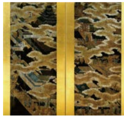
大阪城図屏風 (大阪城天守閣蔵)