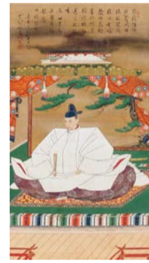
重要文化財「豊臣秀吉像」 慶長3年(1598)賛 京都・高台寺蔵