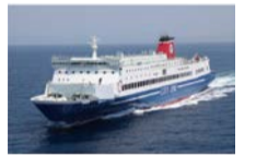
名門大洋フェリー