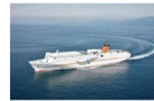
四国オレンジフェリー