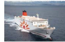
フェリーさんふらわあ