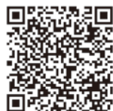
▲新型コロナウイルス感染症のワクチン接種について

65歳以上の高齢者の方(昭和32年4月1日以前に生まれた方)から順次、接種券や予診票などをお送りする準備を進めています。接種については、ワクチンの供給量を踏まえ、まず高齢者施設の入所者から優先して行う予定です。今後のスケジュールや予約開始時期など詳しくは大阪市ホームページをご覧ください。