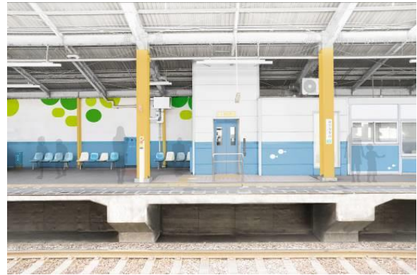
<ホーム階>(イメージ)