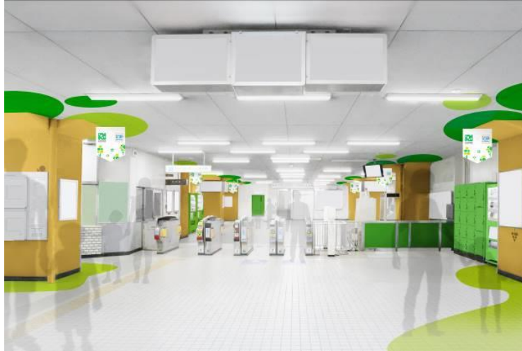
<コンコース階(改札外)>(イメージ)

近畿日本鉄道株式会社(本社:大阪市、社長:都司尚、以下近鉄)とヤンマーホールディングス株式会社(本社:大阪市、社長:山岡健人、以下ヤンマー)は、長居公園および長居植物園のリニューアルに合わせて、植物園の北東ゲートから最も近い駅である針中野駅を長居公園、長居植物園の玄関口として、公園や植物園をイメージした親しみあるデザインにリニューアルします。