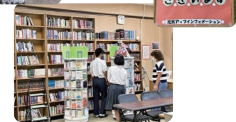
元気アップ・図書室