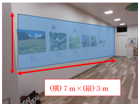
<ミューラル制作場所（針中野駅コンコース）>