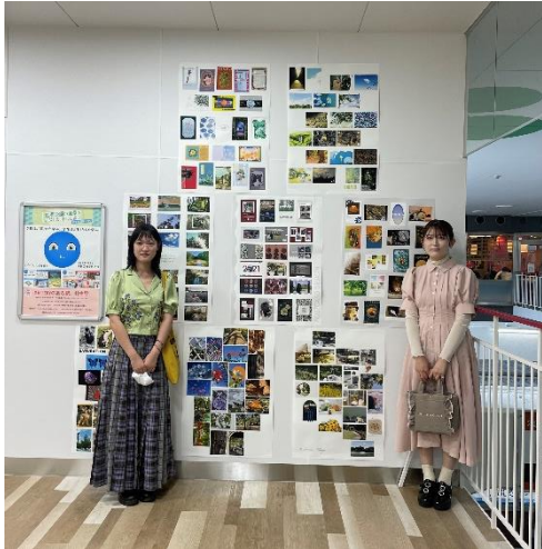
<大阪美術専門学校の作品>