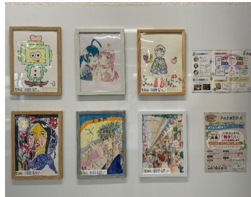
<ともいきアート工房の作品>