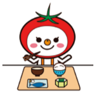
大阪市食育推進キャラクター「たべやん」

毎食「主食・主菜・副菜」をそろえて食べるなど、栄養バランスのとれた食事を実践しましょう。食事の組み合わせを意識することで、栄養面も見た目もバランスのよい食事になります。啓発動画など詳しくはHPをご覧ください。