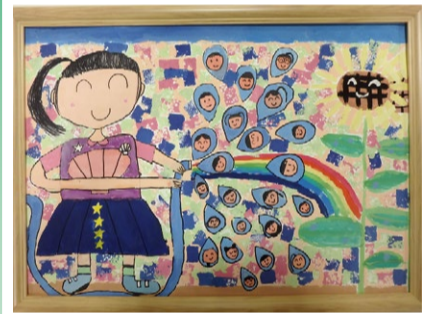
令和4年度 特選賞(2年生)