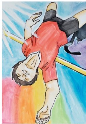
令和4年度 障がい者週間のポスター 小学生部門 最優秀賞作品