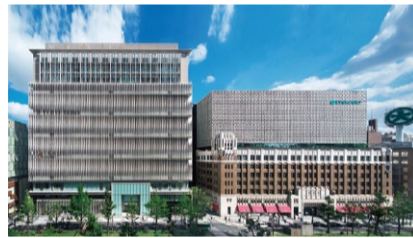
第41回大阪市長賞: 大丸心斎橋本店本館・心斎橋PARCO

周辺景観の向上に資し、かつ景観上優れた建物やまちなみを推薦していただき、特に優れたものを表彰します。