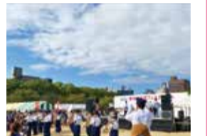
(区民フェスティバル)

地域コミュニティの活性化を目的に、区民フェスティバルや各種スポーツ大会などのイベントを実施します。