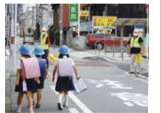
(地域活動協議会 見守り活動)

※3…おおむね小学校区を基本とする地域で、地域を構成する団体や住民等の幅広い参画により、地域運営、地域課題の解決を行うしくみとして設立されています。