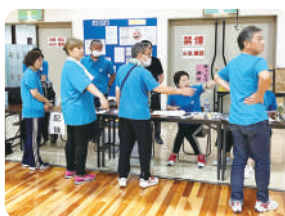
↑大会運営の皆さん

四季を満喫できる日本で生活できることは本当に幸せです。仕事や勉強、趣味やスポーツ、家族との時間など、充実した秋を過ごしたいと存じます。