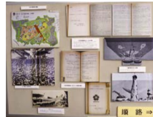
過去の展示の様子

市の歴史や市政に関する理解を深めていただくため、明治から昭和初期に市が主催・後援した博覧会と市の近代都市化について、所蔵する公文書と刊行物を通じて紹介します。ぜひご来館ください。