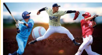
大阪ガス、NTT西日本、日本生命の野球部