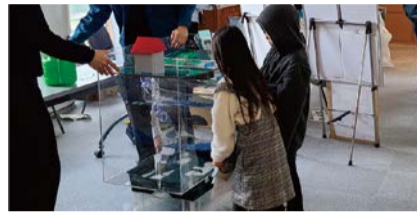
模型による体験の様子