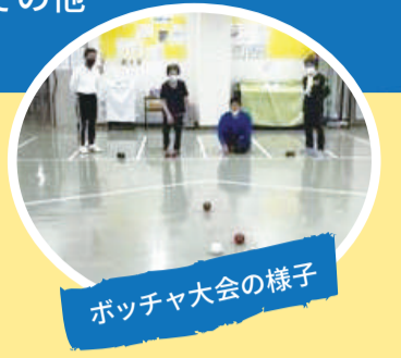
ボッチャ大会の様子

大阪市では、障がいのある人が、身近な地域で「いつでも、どこでも、だれでも」スポーツやレクリエーションを楽しむことができる生涯スポーツ社会の実現とともに、活動を通じて、地域で心豊かに暮らしていける環境づくりに取り組んでいます。東住吉区には、1974年に誕生し、まもなく半世紀を迎える日本初の障がい者専用スポーツ施設の「長居障がい者スポーツセンター」があり、日本の障がい者スポーツの歴史にもなっています。障がい者手帳等をお持ちの方やその介助者や家族、ご友人等と一緒にご利用できますので安心していろいろなスポーツを楽しんでください。