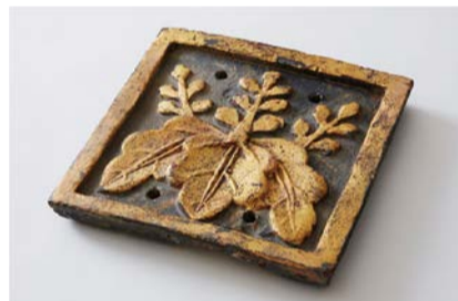
金箔桐文方形飾瓦 大阪市指定文化財 豊田時代 大阪歴史博物館保管

豊臣秀吉が造った大坂城を象徴する金箔瓦や武家屋敷の屋根を飾った家紋瓦などの発掘資料を展示し、大坂城と城下町の姿を紹介します。