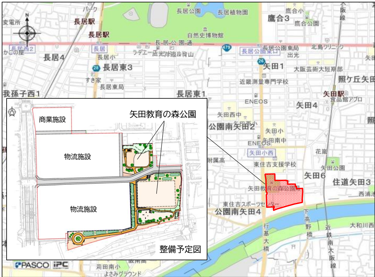
図1 矢田南部地域（矢田教育の森公園）位置図