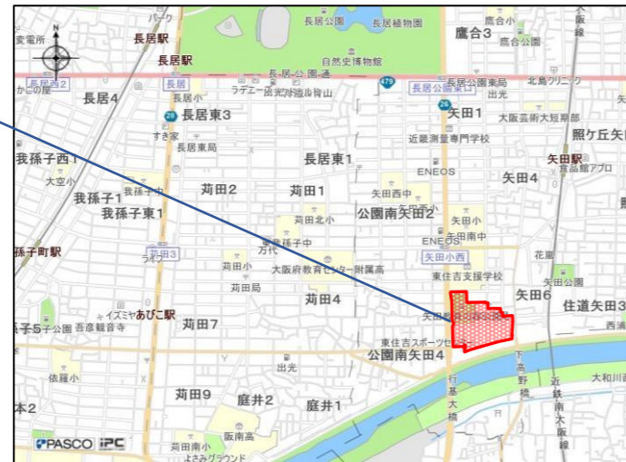
矢田南部地域(矢田教育の森公園)位置図