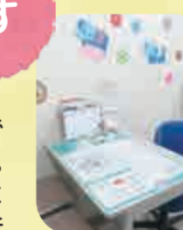
常設健康相談コーナー