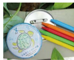
缶バッジ作品イメージ

☎ 9/22(日・祝)・23(月・休) 10:30～14:00 ☎ 場 下水道科学館 ☎ 06-6468-1156 FAX 06-6468-1160