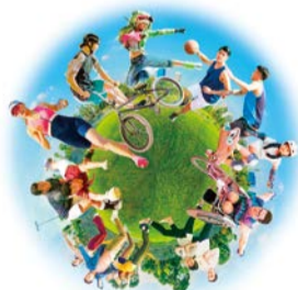
OSAKA NEXPO 2024

バーチャルスポーツ体験やミャクミャクとダンスを踊るプログラムなど、誰もが楽しめるスポーツ体験イベントを実施します。