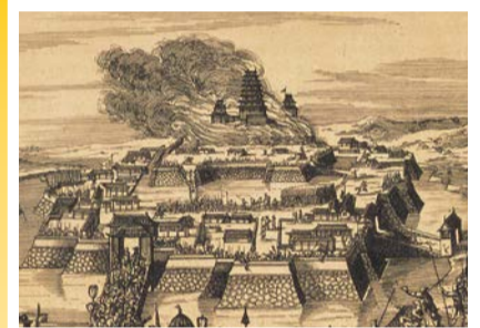
ヨーロッパで紹介された豊臣大坂城の炎上(部分) (モンタヌス「日本誌」より、大阪城天守閣蔵)

石山本願寺合戦、大坂夏の陣、戊辰戦争といった主要な戦いが起こるたびに大坂城は炎に包まれました。本展では、大坂城焼失と戦場で命を燃やした人物ゆかりの資料を紹介します。