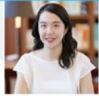
音楽家、数学研究者、 STEAM教育家 中島 さち子