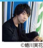
メディアアーティスト 落合 陽一