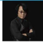
大阪大学教授、 ATR石黒浩特別研究所 客員所長 石黒 浩