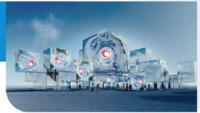
©2024 Yoichi Ochiai / 設計: NOIZ / Sustainable Pavilion 2025 Inc. All Rights Reserved.

ヌルヌルと変形することで周囲の風景や人物をゆがめ、未知の風景を生み出すパビリオン。デジタル化された自分自身と対話するような不思議な体験ができます。