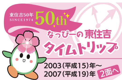
広報東住吉「なでしこ」タイトルロゴ コンテストについては2面へ