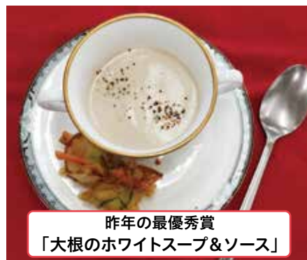
昨年の最優秀賞 「大根のホワイツスープ&ソース」

なにわの伝統野菜「田辺大根」を使ったユニークで斬新なレシピを募集します。 応募者全員にオリジナルの記念品を贈呈します。