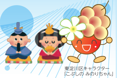
東淀川区キャラクター 「こぶしのみのりちゃん」