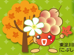
東淀川区キャラクター「こぶしのみちゃん」