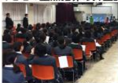
女性被害防止教室