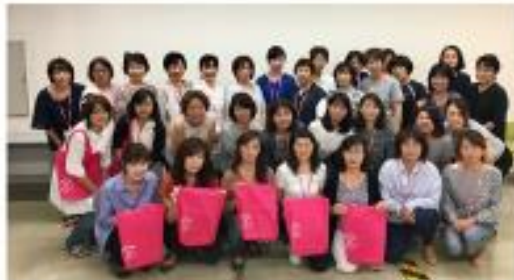
こんにちは赤ちゃん訪問事業 地域推薦訪問員の乳児訪問