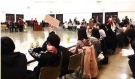
青少年育成推進事業（中学生ウルトラクイズ）