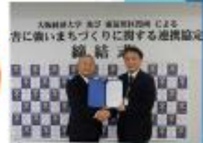
↑大学との防災協定 (H29.1)