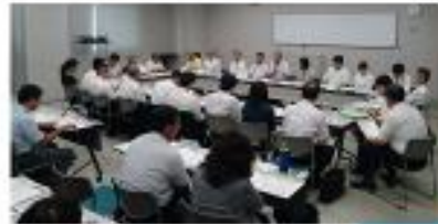
←新大阪駅周辺 帰宅困難者 協議会(H29)