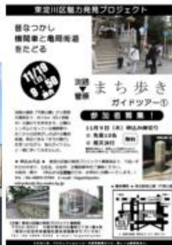
魅力発見プロジェクト 区民による魅力発掘・発見