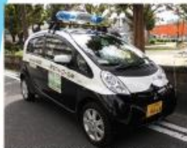
青色防犯パトロール（職員・地域・夜間委託で巡回監視）