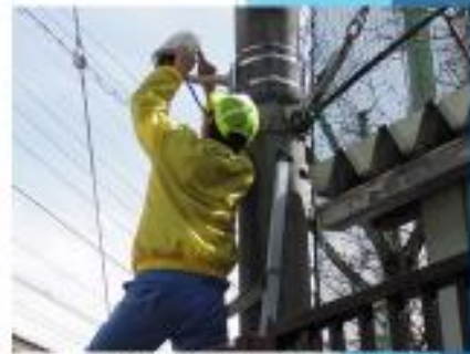
防犯カメラの維持管理