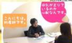
助産師による相談支援 専門的家庭訪問支援