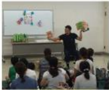
絵本読み聞かせ事業