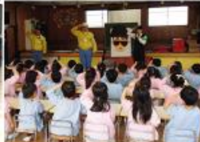
誘拐被害防止教室