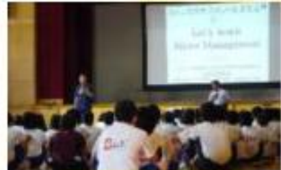
ゲストティーチャー派遣事業