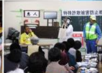
特殊詐欺被害防止教室