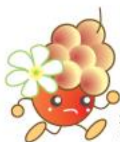
東淀川区キャラクター こぶしのみのりちゃん