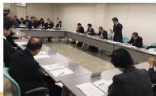
区教育行政連絡会