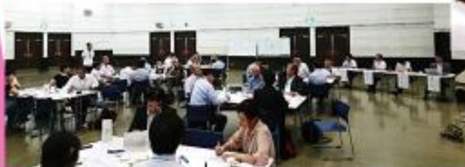
異次元交流ライブ