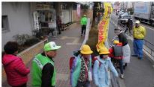
青少年育成推進事業（登下校見守り）