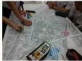
小中学校の防災教育