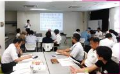
BCP（事業継続計画） 企業等との連携

様々な活動を通じて連携を深め、 新たな担い手の発掘・魅力ある まちづくりをめざす