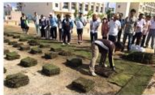
校庭等の芝生化事業