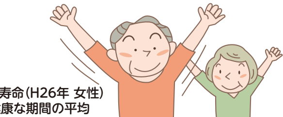
寿命(H26年 女性) 康な期間の平均

いちゃん、去年より歩くの遅くなったかも。 に集まり「いきいき百歳体操」で健康になる 地域でも、体操をしたり食事をしながら交 アの方々です。青パトもそうだけど、高齢者 えられているんだとわかりますね。