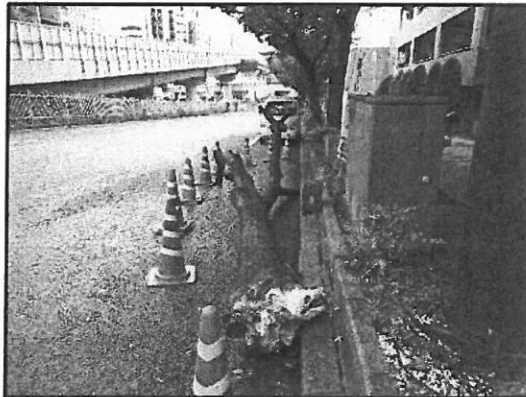
腐朽菌の侵入による倒木事故