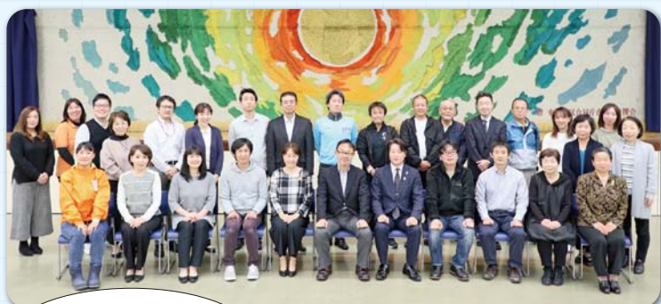
東淀川区区政会議の 委員の皆さん