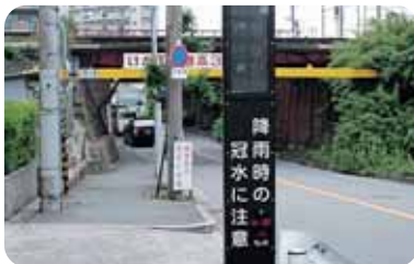
付近には、写真のような「冠水表示板」または「道路情報板」があります