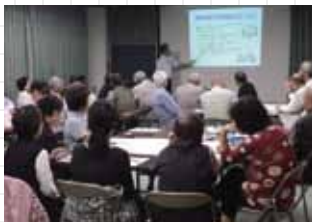
西淡路地域防災学習会