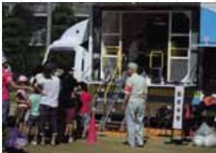
小松地域防災訓練

東淀川区では「東淀川区地域防災計画」を地域住民が主体となる自助・共助を基本として策定しました。防災・減災には、行政による公的支援はもちろんのこと、地域活動協議会を中心に、地域住民、地域の企業、NPO、医療従事者、学生など様々な活動主体が協働し、それぞれの役割を一層明確にして、地域の防災力の向上を図っていくことが重要です。