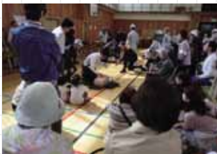
新庄地域防災訓練