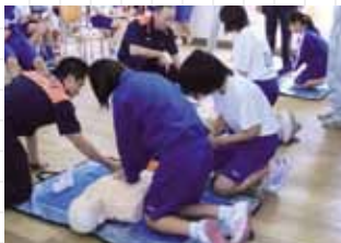
新東淀中学校防災研修