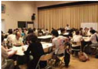
ノーマライゼーション協会防災学習会