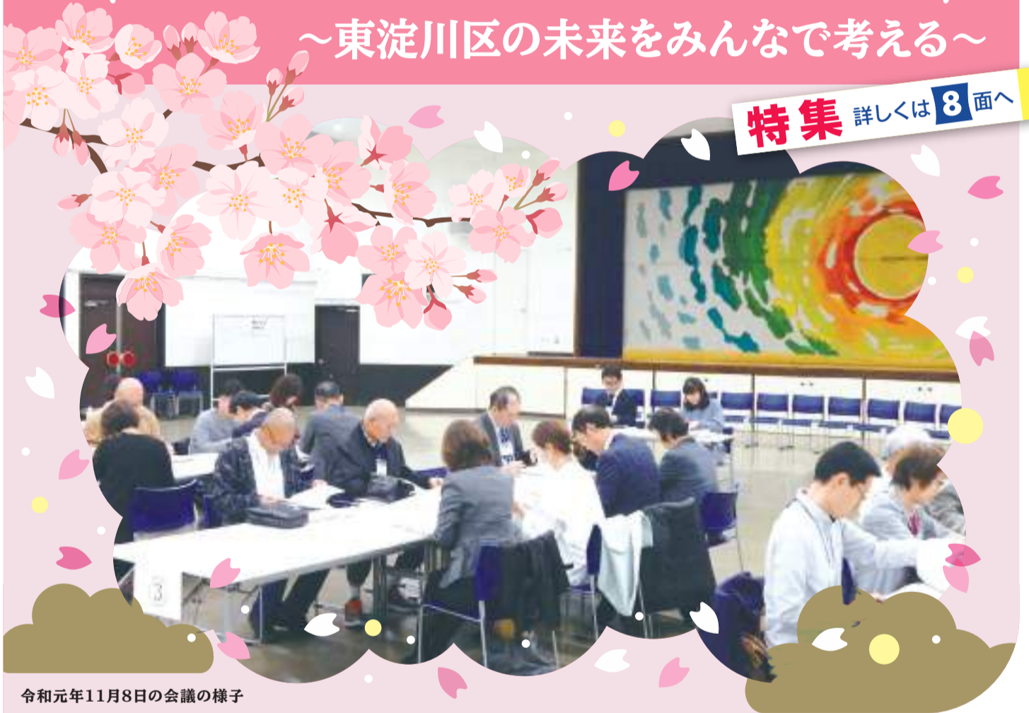
令和元年11月8日の会議の様子