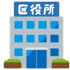
くやくしよ 区役所