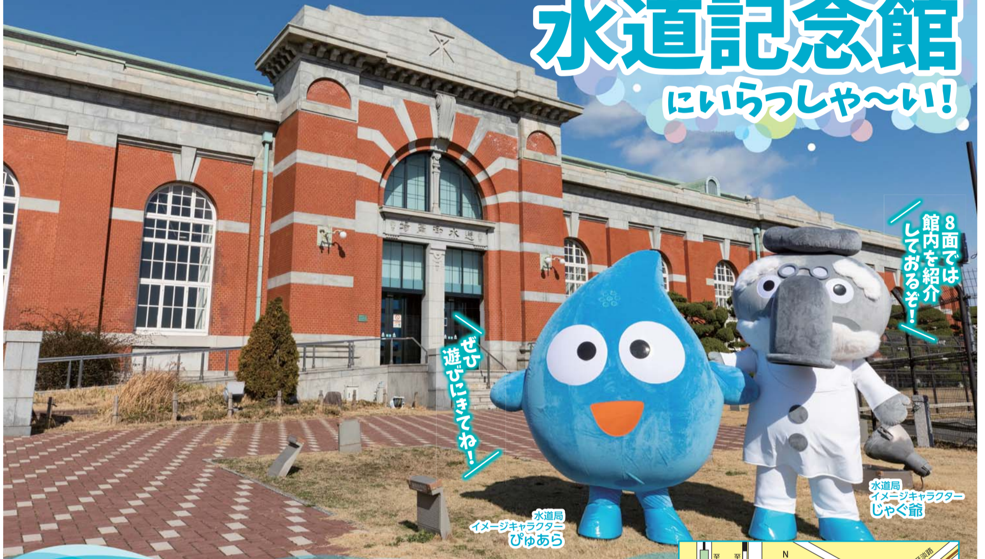
「わっしょいちゃん」