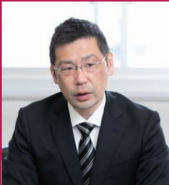
大阪府東淀川警察署 生活安全課 防犯係 係長

東淀川警察署 ☎6325-1234 / 安全安心 1階8番 ☎4809-9819