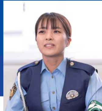
大阪府東淀川警察署 交通課 交通総務係 係員