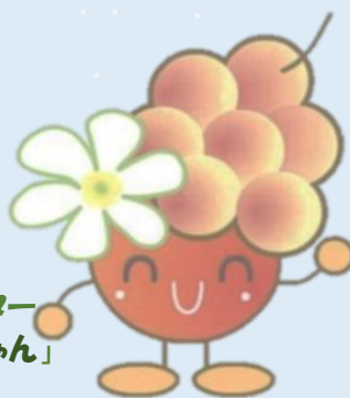
東淀川区キャラクター 「こぶしのみのいちゃん」

「この手続きは区役所でできるの？」 「区役所のどの窓口で相談したら良い？」 「区役所でも配布していたなんて、 知らなかった」