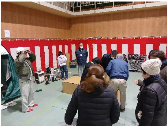
・区役所職員の災害用トイレ等の説明