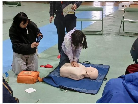
・東淀川消防署員による AED 訓練