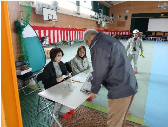
・避難場所にて受付及び安否確認