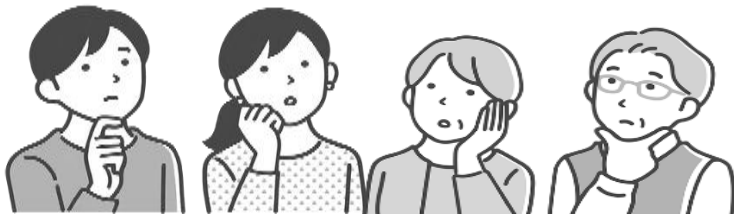
ご本人への対応方法に 悩んでいるご家族