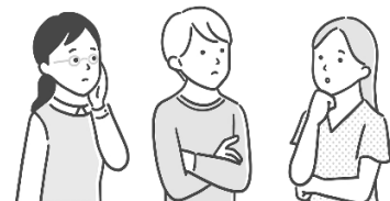
知識や解決方法を 学びたい方