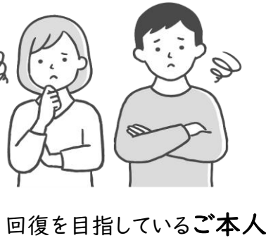
回復を目指しているご本人