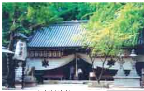
⑨旭神社 治水雨乞い祈願所。古樹は天然記念物。