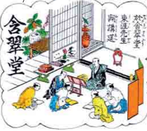
⑪含翠堂跡 平野七名家の一人土橋友直らによって創設された大阪初の民間学問所である。郷民の教育や窮民救済を行った業績が大きい。