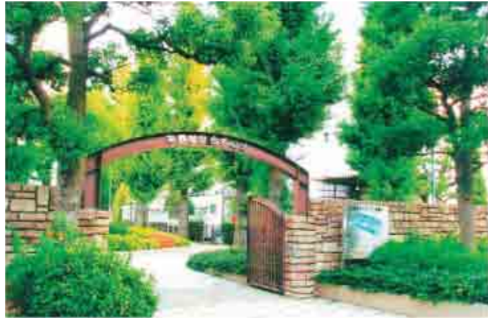
⑦平野せせらぎの里 下水を高度に処理したきれいな水で、自然にある水田や小川を思わせる、せせらぎの水辺を作っている。