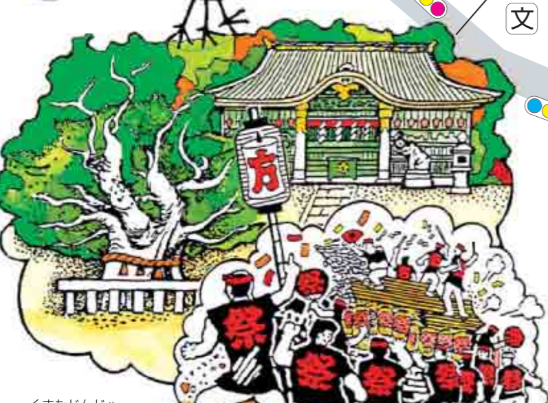
⑬杭全神社 坂上廣野麿の子当道が素盞鳴尊を氏神として祀った。全国で唯一、連歌所が残っている。