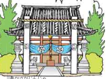
○10月の中頃、赤坂神社の秋祭りに集まった、だんじり大好きの、仲良しちびっ子達!!