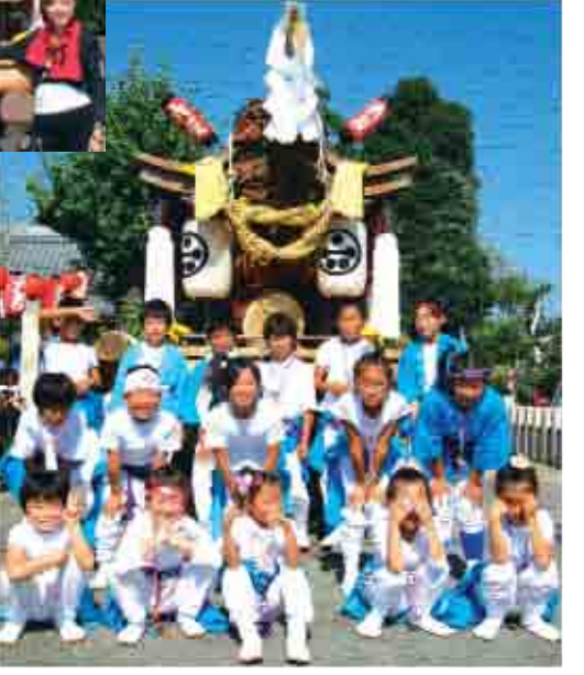
○10月の中頃、赤坂神社の秋祭りに集まった、だんじり大好きの、仲良しちびっ子達!!