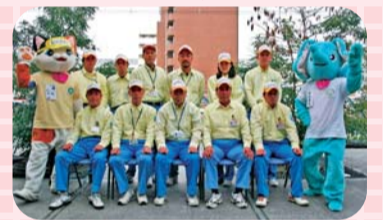
隊員一同がんばっていきます!!

平野区が「地域安全対策推進モデル区」になったことに伴い、C・A・T隊もこれまでの業務での経験や資料に基づいた効果的な防犯啓発活動を引き続き行うとともに、「子ども110番の家」の設置をさらに増やしていく等、区民のみなさんと協働しながら、街頭犯罪による子どもたちの被害が減少するよう取り組んでいきます。今後ともご理解とご協力をいただきますようよろしくお願いいたします。