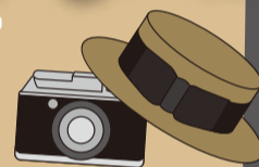
東住吉区時代の庁舎の写真

平野区の昔の写真や動画を集め、未来へつなぐ平野区今昔アーカイブ(資料集)を作成します。 平野区の昔の写真などをお持ちの方は、ぜひ平野区役所まで情報をお寄せください。