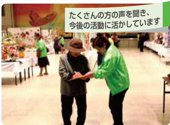
たくさんの方の声を聞き、 今後の活動に活かしています