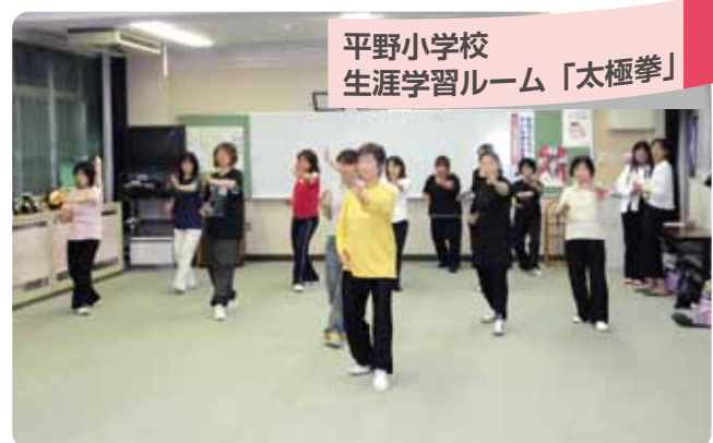
平野小学校 生涯学習ルーム「太極拳」