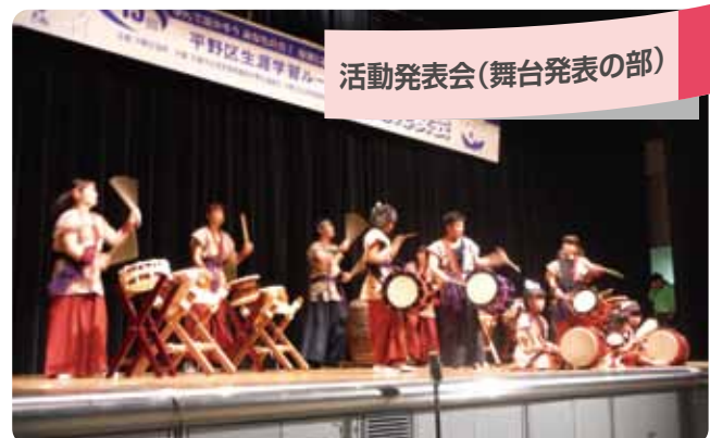
活動発表会(舞台発表の部)