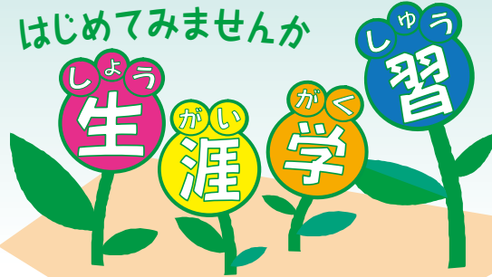
生涯学習ルーム・ マスコットキャラクター 「スタートル」