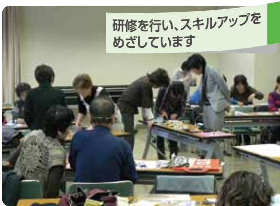
研修を行い、スキルアップを めざしています

■各小学校の「生涯学習ルーム運営委員会」の推薦により、養成講座を修了後、市長の委嘱を受けた方で、大阪市・小学校・地域をつなぐパイプ役となって地域の生涯学習を推進している市民ボランティアです。また、“生涯学習推進員平野区連絡会”を組織し、各小学校の生涯学習ルーム活動の情報交換を行ったり、学んだ成果を発表する活動発表会を開催したりするなど、アイデアを出し合いながら、和気あいあいと楽しく活動しています。