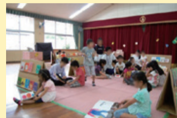
絵本の読み聞かせ