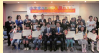
小学生のための英語セミナー