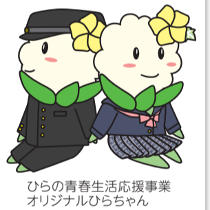
ひらの青春生活応援事業 オリジナルひらちゃん

問合せ officeドーナツトーク ☎070-6549-6418 ✉office.donutstalk@gmail.com 保健福祉課(地域福祉)⑮番窓口 FAX 4302-9943