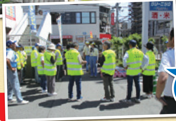
地域の皆さんの活躍で、平野区内の犯罪・放火件数が減少しています。