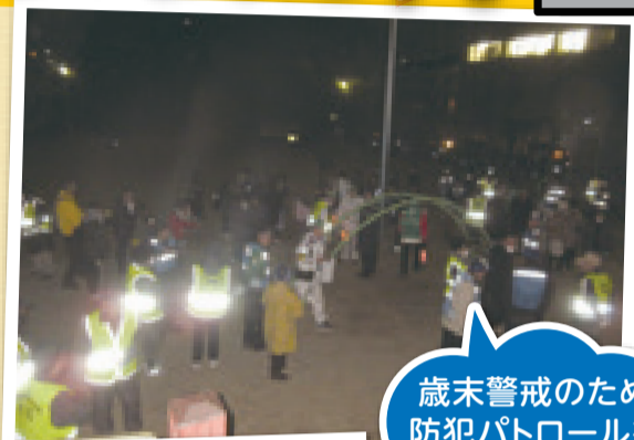
歳末警戒のため防犯パトロールを強化します。