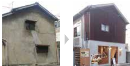
改修イメージ(改修前→改修後)

空家の利活用を予定されている方に、住宅の性能向上や、こども食堂・高齢者サロンといった地域まちづくりのための用途に改修する費用等の一部を補助します。補助内容など、詳しくは☎をご覧ください。