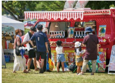
キッチンカー、マルシェ