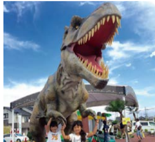
公園に恐竜が出現!?