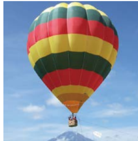
熱気球体験 (大芝生広場) ※事前申込必要